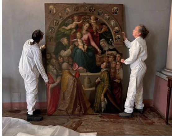
Le restauratrici del laboratorio Grazia Ferrari con l'opera restaurata Madonna del Rosario di Borgo San Martino e che sarà esposta alla mostra

Il gradimento sempre manifestato dalla committenza soprattutto religiosa nei confronti dell'opera di Caccia permette di considerare il pittore uno di quelli che meglio seppe interpretare il gusto e la devozione del proprio tempo. Da questa doppia ricorrenza e da questa grande affinità tematica tra i due progetti che porta sempre di più al centro le persone, le comunità ecclesiarie e civili nasce l'idea di una mostra suddivisa in due sezioni che raccoglie i contributi di ricerca sviluppati nel corso di mesi di lavoro e che da una parte presenta un excursus librario e archivistico sul tema del Giubileo e del pellegrinaggio e dall'altra si configura come un'esposizione di alcune opere particolarmente significative di Guglielmo Caccia